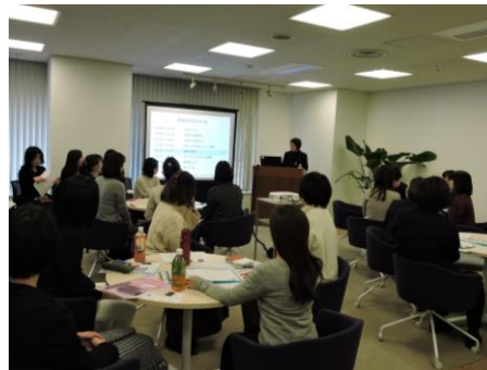
フォーラムの様様