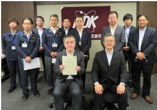
関係者記念撮影 (NTT 西日本 P&S 戦略室、近畿電機)

近畿電機では、長年にわたりNTT 西日本の通信機器の修理や再生業務を受託しています。機器出荷時に使用する個装箱の改良を実施し、梱包用ビニール袋撤廃による地球環境改善への貢献や、箱サイズの縮小化による紙資源、輸送・保管コストの低減に繋がった事を評価され、感謝状と記念品を受贈する事となりました。